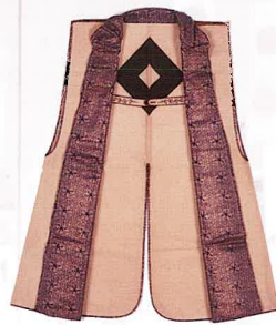
一柳直盛着用陣羽織(兵庫 小野市立好古館蔵)